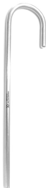
CK 186 130 mm (5 1/8"), Ø 4,0 mm