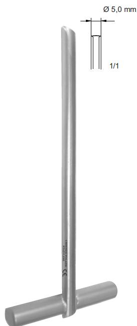
CK 185 114 mm (4 1/2")